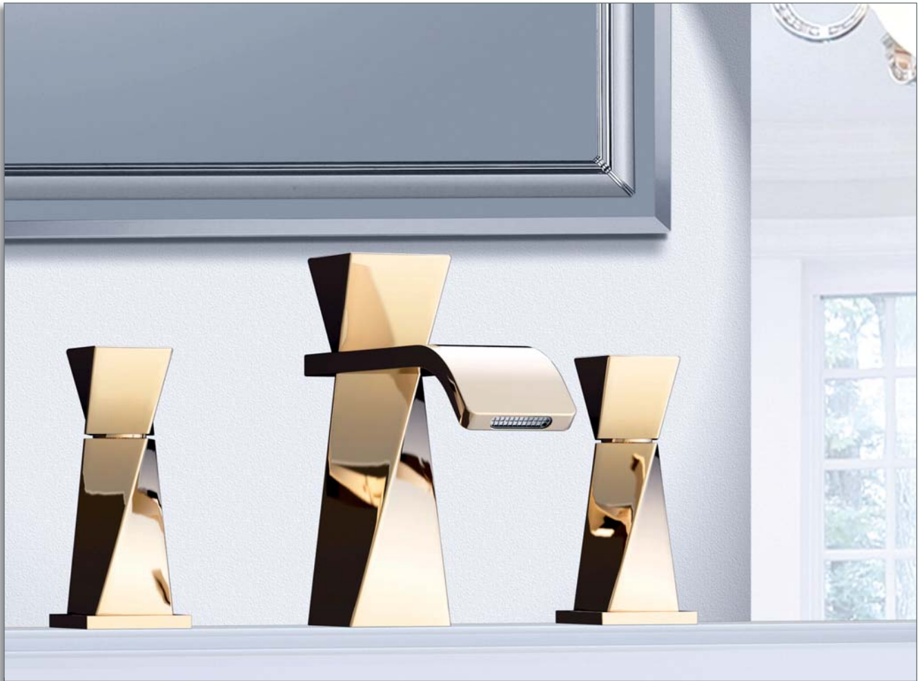
Waschtisch 3-Loch Batterie, edelmessing

Armaturen- u. Accessoiresfabrik GmbH Seckenheimer Landstraße 270-280 68163 Mannheim / Germany Telefon : +49 (0)621-4109701 Telefax : +49 (0)621-4109710 E-Mail : info@joerger.de Internet : www.joerger.de